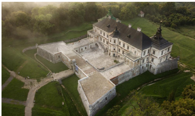
Zamek w Podhorcach

„Znam Podhorce i uważam je za skarb wprost nieoszacowany” – mówił o jednym z najwspanialszych, a zdaniem wielu najwspanialszym, kresowym pałacu, Henryk Sienkiewicz. Cztery lata wystarczyły hetmanowi Stanisławowi Koniecpolskiemu, aby wznieść ten pyszny palazzo in fortezza, mający służyć mu jako miejsce dla „uciek smacznego wypoczynku po wojskowych trudach”. Nad planami letniej rezydencji hetmana pracował królewski architekt Andrea dell’Aqua oraz sławny inżynier wojskowy Guillaume le Vasseur de Beauplan. Prace wykończeniowe trwały bez mała dwadzieścia lat. Pałac był otoczony systemem fortyfikacji z fosą i kazamatami. Pomieszczenia reprezentacyjne mieściły się na pierwszym piętrze, na które wchodziło się wprost z tarasu.