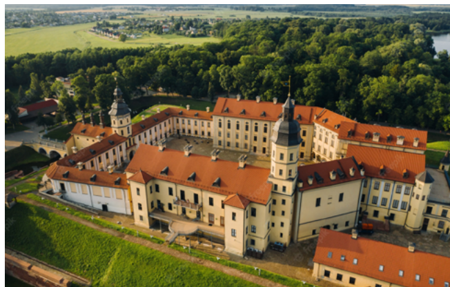
Zamek w Nieświeżu

Między jeziorami Panieńskim a Pionierskim, w 1533 roku, w Nieświeżu, Radziwiłłowie zbudowali swoją rezydencję, z której zarządzali potem powstała pół wieku później ordynacja nieświejską. Do drugiej wojny światowej stanowiła ona największy kompleks dóbr prywatnych w Rzeczypospolitej. Najwięcej starań o urządzenie rodowej siedziby i budowę miasta podjął Mikołaj Krzysztof „Sierotka”, który powierzył projekt zamku Janowi Marii Bernardoniemu. Architekt wystawił trójkondygnacyjny pałac z czterema wieżyczkami w narożach, wyposażony, jako pierwszy w Rzeczypospolitej, w pełni wykształconymi nowoczesnymi fortyfikacjami bastionowymi. Do dzisiaj zamek otacza stuhektarowy zespół parków, największy na Białorusi.